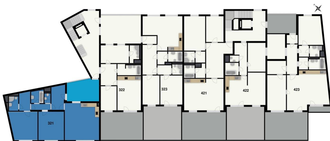
2. nadzemní podlaží - dvorní trakt

Všechny informace a vyobrazení jsou pouze orientační. Kuchyňská linka není součástí dodávky.