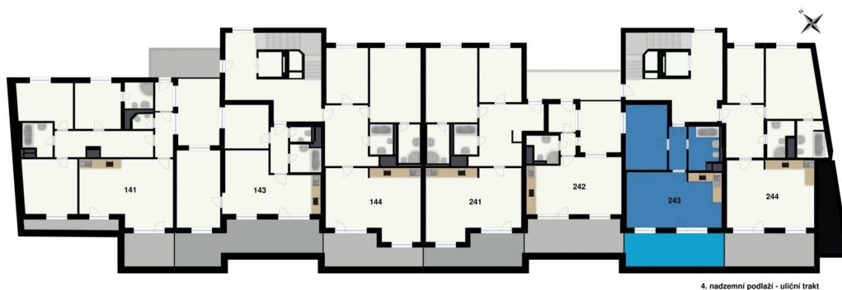
4. nadzemní podlaží - uliční trakt

Všechny informace a vyobrazení jsou pouze orientační. Kuchyňská linka není součástí dodávky.